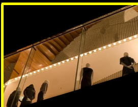
六本木夜景 大橋八洲男