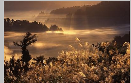
朝光 芒の谷 田辺洋一

[ EOS-1V / EF70-200mm F2.8 / f22 s1/10 ]